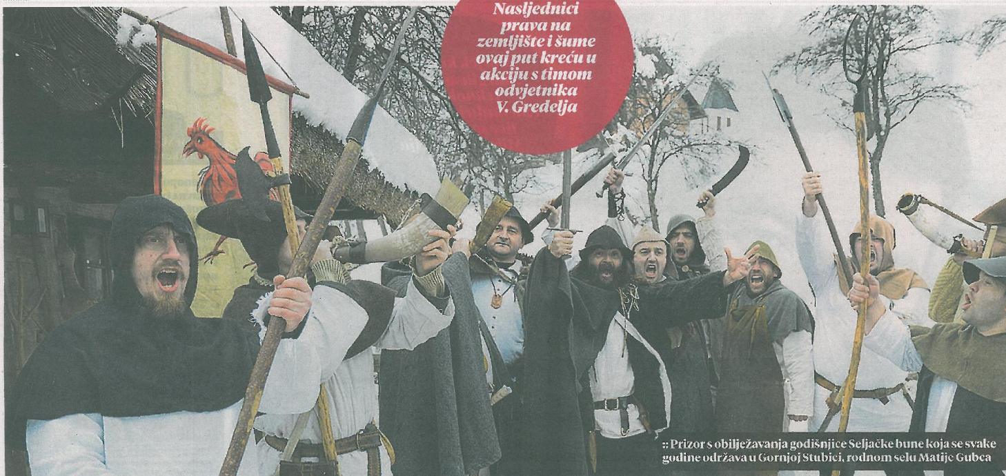
Prizor s obilježavanja godišnjice Seljačke bune koja se svake godine održava u Gornjoj Stubici, rodnom selu Matije Gubca

Nasljednici prava na zemljište i šume ovaj put kreću u akciju s timom odvjetnika V. Gredelja